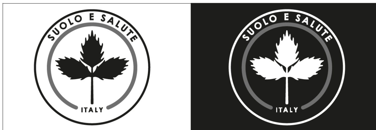
Fig. 2 Logo B/N e N/B